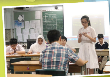
聯校英語辯論比賽