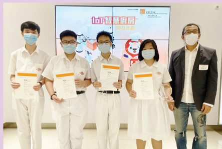
同學利用科技回饋社會，於「IoT 智慧廚房開發計劃」中，本校學生把物聯網(IoT)概念融入設計，於比賽勇奪冠軍。

本校積極發展STEM教育，培養學生運用科學科技知識解決難題。拓展與大專院校及企業的合作，藉以擴闊學生視野，提升學生在科學科技的知識素養。本校學生踴躍參與各項科學及科技相關的比賽及資優課程，屢獲殊榮。