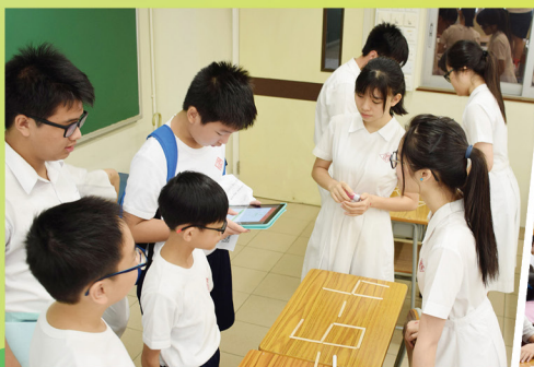
本校邀請沙田區三間小學參加一年一度的數學遊蹤活動，提昇小學生對數學的興趣及解難的能力。

本科老師亦一直致力提升教學質素，上學年本科老師與香港大學合作，參加其主辦之校本支援計劃，透過教授評估教學策略，發展校本教學材料，提升老師利用英語進行數學教學的水平，促進學生運用英語學習數學的能力。