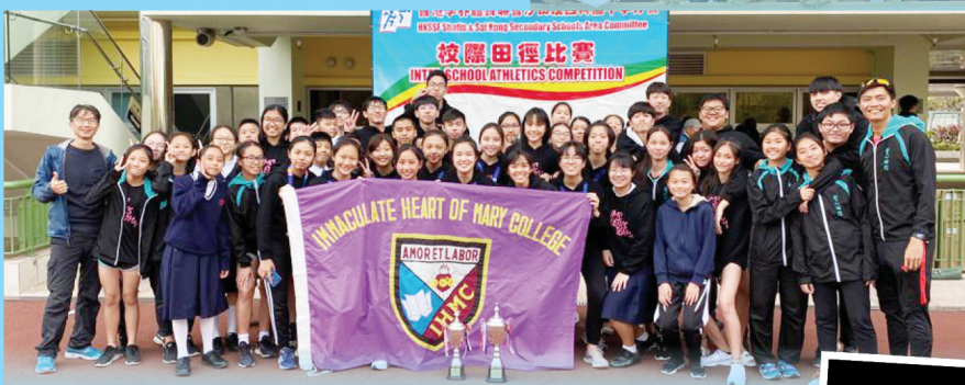
田徑隊於每年的學界比賽表現出色