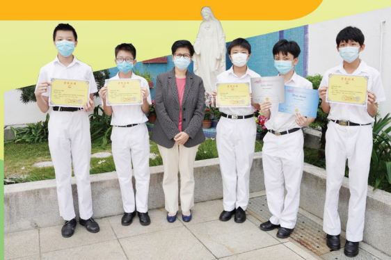
學生在各項校外數學比賽均表現優異