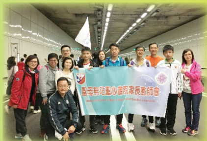
家長老師齊參與公益金百萬行活動

家校合作是培育學生成長的重要一環，老師除定期聯繫家長外，本校亦成立家長教師會，積極舉辦不同活動，安排家長擔任網絡大使及家長義工、舉辦家長教育講座及工作坊、社區義工服務及敬師活動，以加強家校聯繫及促進家長與教師之間的情誼，以期共同培育學生健康成長。