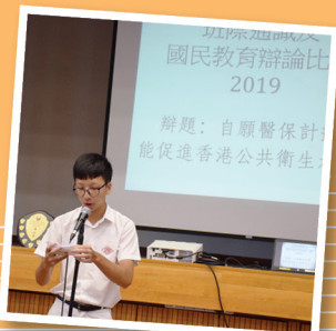
班際通識及國民教育辯論比賽

在初中階段，學生以探究式學習有關香港、中國及世界的各項議題；至於高中，在培養良好公民素質的前提下，透過上課及一系列課外活動，培訓學生的批判思維。