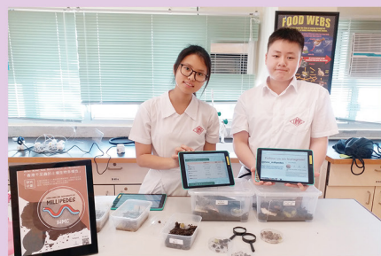
本校成為香港中文大學「香港千足蟲的土壤生物多樣性」研究計劃夥伴學校。