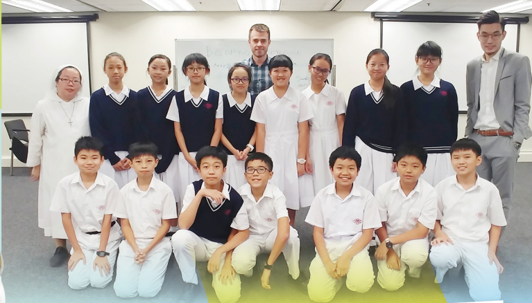
語文常委會活動計劃