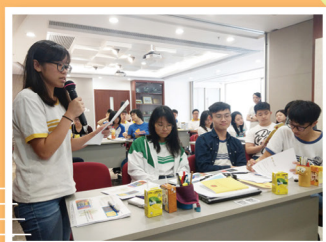
學生參與香港教育大學香港研究學院暑期課程，探究「一國兩制」在香港的實踐狀況。