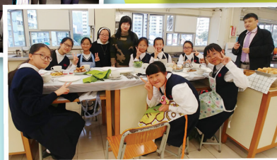
愛爾蘭文化體驗活動