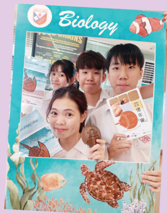
參與由香港海洋公園保育基金及香港城市大學舉辦的「馬蹄蟹校園保育計劃」