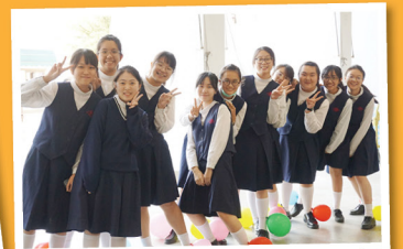
每年均舉辦不同類型的師生比賽，增進師生關係。