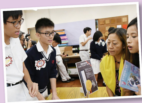
中三級同學運用電腦科及設計與科技科所學製作智能家居防盜裝置，於本校資訊日向公眾作介紹。

生物科及綜合科學科積極發展生物科技相關的STEM教育，讓學生使用新添置的器材進行生物科技實驗，例如DNA指紋分析法、PCR、基因轉化熒光細菌等實驗。