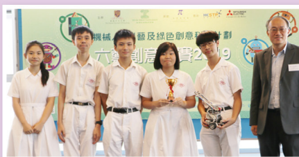
本校學生運用micro:bit及LEGO製作的機械人展示「后羿射日」的故事，在「六藝創意比賽2019」中奪得三等獎。