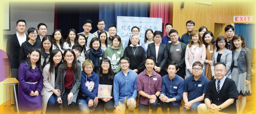
校友會透過不同活動凝聚校友，使校友們畢業後繼續回饋母校。

本校校友人才輩出，在不同的專業成就驕人，同時亦以聖母瑪利亞之信德為榜樣，服務社群；校友們亦不時回饋母校，以不同形式協助母校發展，例如每年的校友職業分享日，不同專業界別的校友回校與學弟學妹作職業分享。